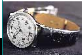
集團版權使用商之時尚 金利來品牌產品