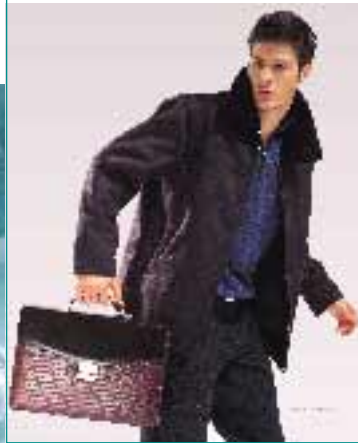
集團版權使用商之時尚 金利來品牌產品