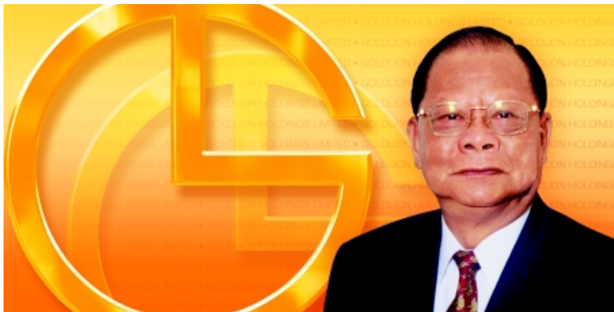
本集團主席 曾憲梓博士，大紫荊勳賢