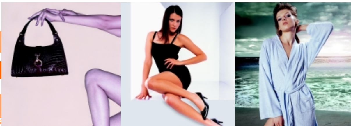
集團商標使用商之時尚金利來品牌產品