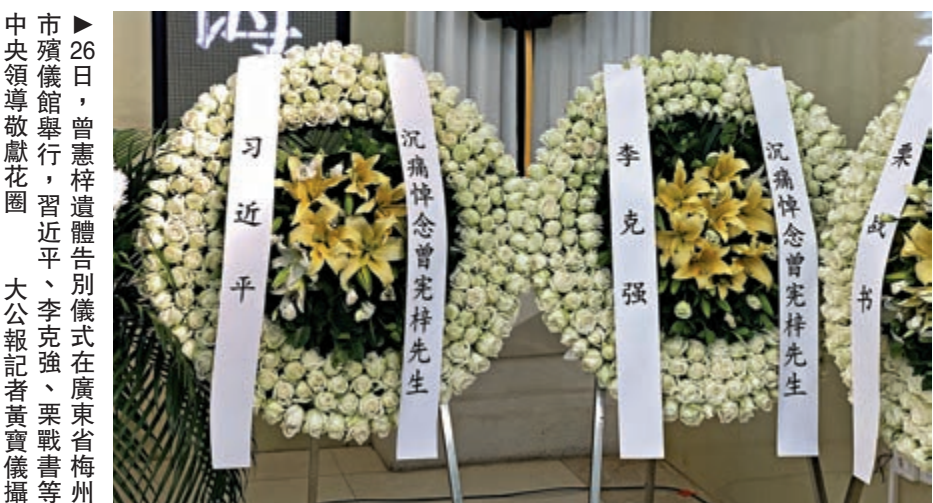
26日，曾憲梓遺體告別儀式在廣東省梅州市殯儀館舉行，習近平、李克強、栗戰書等中央領導敬獻花圈。大公報記者黃寶儀攝