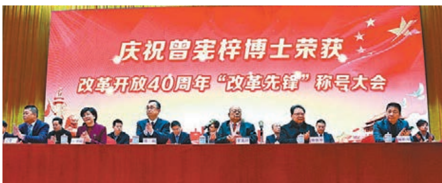
慶祝曾憲梓榮獲改革開放40周年「改革先鋒」稱號大會於梅州舉行。資料圖片

她續說，曾憲梓多年來熱心服務社會，回歸前出任香港基本法諮詢委員會委員、港事顧問和特區籌備委員會委員，為香港平穩過渡作出重要貢獻。她對曾憲梓的辭世深感哀痛，謹代表香港特別行政區政府向他的家人致以深切慰問。