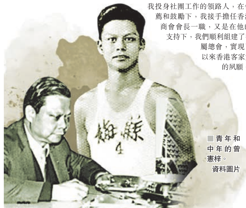
青年和中年中的曾憲梓。資料圖片

港區全國人大代表顏寶鈴指，曾老先生溘然長逝，給我們留下的是無限的哀痛和悼念，以及不盡的物質和精神財富。曾老早年來港後自強不息白手興家，是商界引以為傲的典範和榜樣；又積極回饋社會，其愛國愛港、桑梓情深、樂施好善的赤子之心有口皆碑、萬人敬仰。在沉痛悼念曾老的時候，希望大家珍惜、愛護前輩們所建設的香港，抵制暴力亂港，共同守護我們的家園。