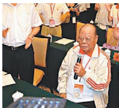
曾憲梓唱《沒有共產黨就沒有新中國》。資料圖片