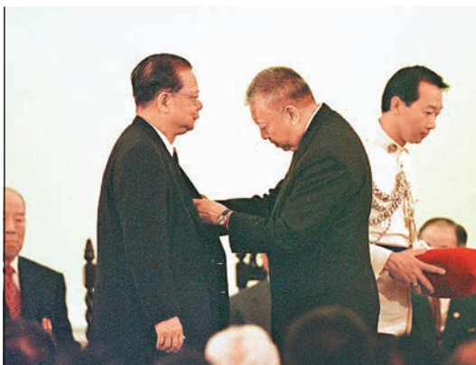
曾憲梓1997年獲頒大紫荊勳章。