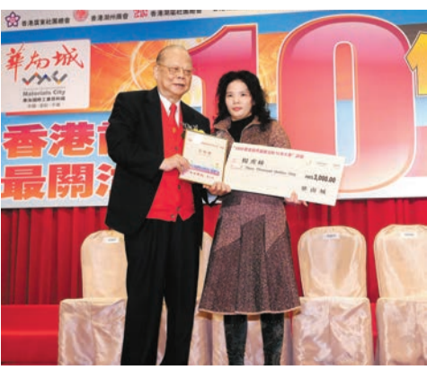
在2008年香港商界最關注十件大事評選頒獎禮上，曾憲梓(左)向得獎者頒獎。

金利來的成功，離不開改革開放。中國如今的成就也離不開像曾憲梓這樣的香港商人大力支持。事實上，在改革開放前20年，香港不少資本進入內地尤其珠三角一帶，成為珠三角地區經濟發展的動力，港商當時不僅為珠三角引入先進的工業技術和管理制度，還為內地日後的經濟飛躍奠定了良好基礎。經過改革開放40年的發展，內地已從勞力密集型的加工大國，轉型升級為創新驅動發展，成為全球第二大經濟體。