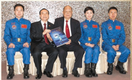
2012年，曾憲梓於曾憲梓載人航天基金會2012年度頒獎大會上，與神九3位航天員合照。