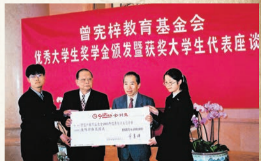
2002年，曾憲梓向貧困優秀大學代表頒發獎學金。

2012年8月23日，曾憲梓在第30屆倫敦奧運中國內地金牌健兒的頒獎大會上表示，基金將在原來的基礎上再追加1億港幣，即增加4屆奧運會的獎金，獎勵活動將持續至2036年。2016年9月1日，第31屆里約奧運會頒獎典禮在北京國家體育總局召開，曾智明代表父親曾憲梓宣布，基金會獎金在原2億港元基金的基礎上再次追加1億港元，達到3億港元。基金會至今獎勵曾在奧運會上獲得金牌的中國內地體育健兒有176人次，頒發獎金總額逾港幣7500萬元。