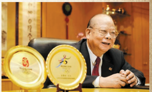
2008年，曾憲梓捐資1億港元成立體育基金獎勵中國奧運金牌運動員。資料圖片