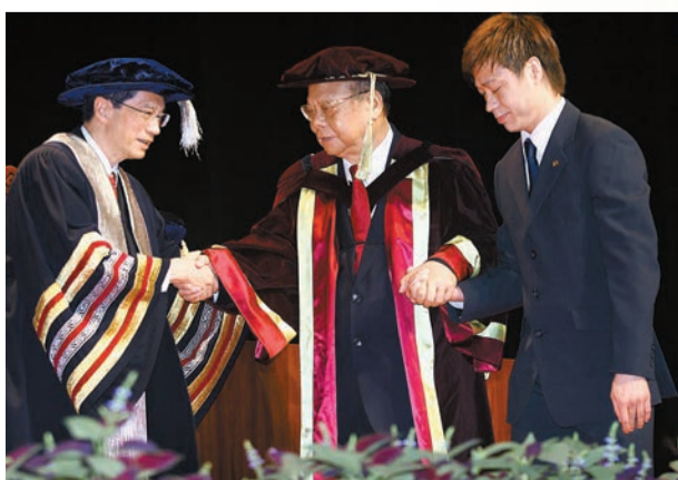
香港理工大學校長潘宗光(左)向曾憲梓(中)頒授榮譽社會科學博士學位。資料圖片